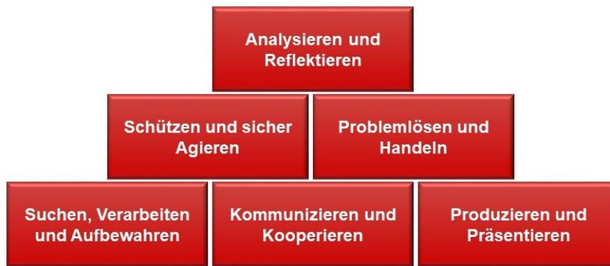
Abbildung 1: Kompetenzbereiche der Medienbildung

Diesen werden Teilkompetenzen zugeordnet, welche bei den Schülerinnen und Schülern bis zum Ende der Regelschulzeit zu entwickeln sind. 5